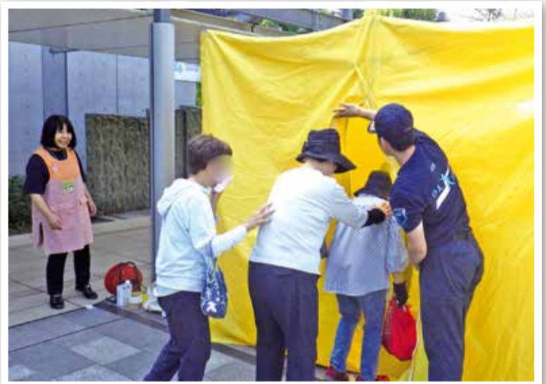
ふれあい防災訓練の様子

地域福祉コーディネーターは、地域に出向いて課題を把握し、必要な機関や人をおつなぎするなど、地域で困りごとを解決するためのお手伝いをしています。ある地域では、自治会や民生児童委員とともに住民アンケートや地域懇談会を行い、「日ごろから情報交換ができる場があると良い」と意見が上がったことから、住民と協働で定期的な交流の場を設けています。さまざまな世代が感じる日常生活の困りごとや関心事を共有し合う中で、地域交流を目的としたふれあい防災訓練の開催にもつながりました。