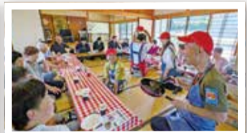
能登半島地震(輪島市)でのサロン活動の様子

杉並区公式チャンネル「すぎなみスタイル」にて「災害ボランティアセンター～被災者とボランティアをつなぐ～」が公開されています!ぜひご覧ください。 【URL】 https://www.youtube.com/watch?v=AKx31kjwcsQ