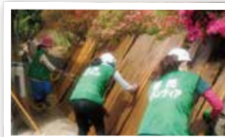
東日本大震災(気仙沼市)での洗浄の様子