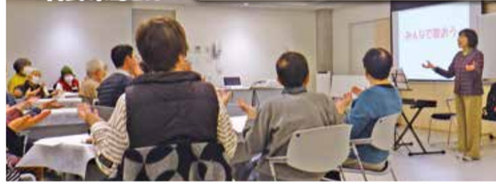
きずなサロン多満りばinすぎはち

サロンを通じた住民同士のつながりづくりは、災害時にも役立つと思って活動を続けています。きずなサロン多満りばでは「ちょこっと防災」として防災知識もお伝えしています。