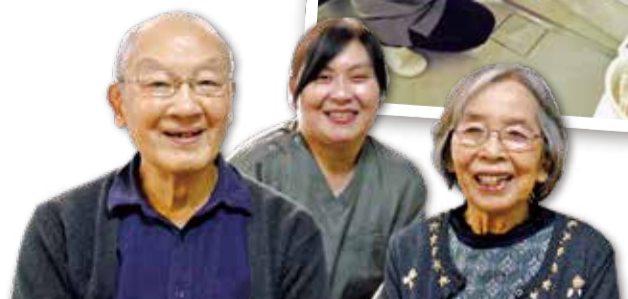
利用会員Iさんご夫婦と協力会員Mさん(中央)