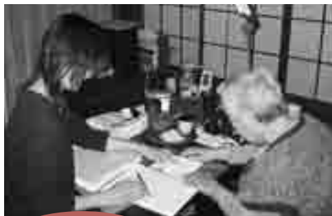
一人ひとりの権利をまもるお手伝い 地域福祉権利擁護事業