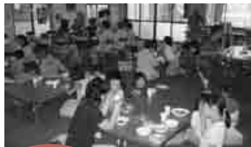
地域づくりのお手伝い 和田堀寺子屋「夏休み子ども会」

会員には2種類あります。社協の事業に活動者として登録をしている活動会員 (平成20年度はささえあい協力会員のみ) と、財政面で協力をしてくださる賛助会員です。賛助会員の皆様には、「会費」を納めていただくことが会員としての「活動(協力)」であり、それが地域福祉活動を進めていく大切な財源となります。