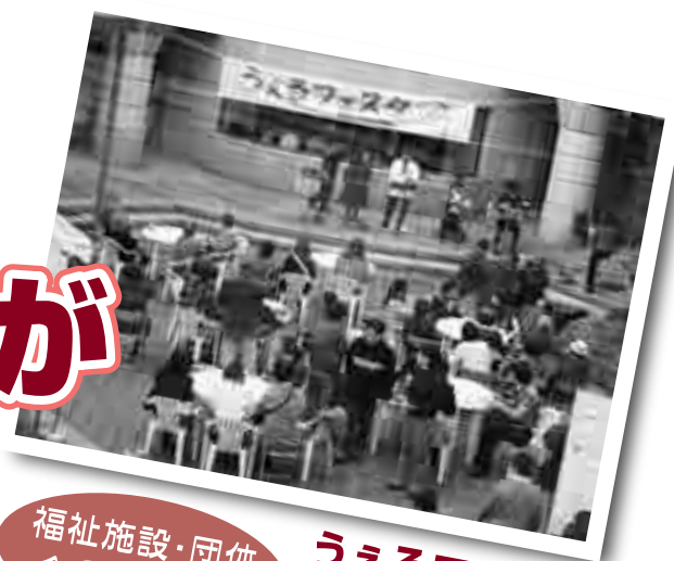
福祉施設・団体へのお手伝い