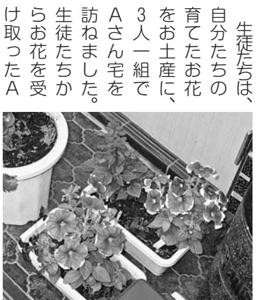
玄関に飾られた生徒たちの育てたお花

都立高校には、「奉仕」の時間が設けられています。農芸高校では、この時間を使い、これまでも「ゴミ拾い」などの活動をしてきましたが、地域の高齢者との関わりが持てないかと思ひ、民生委員さんに高齢者宅を紹介してもらい、この試みを実現しました。